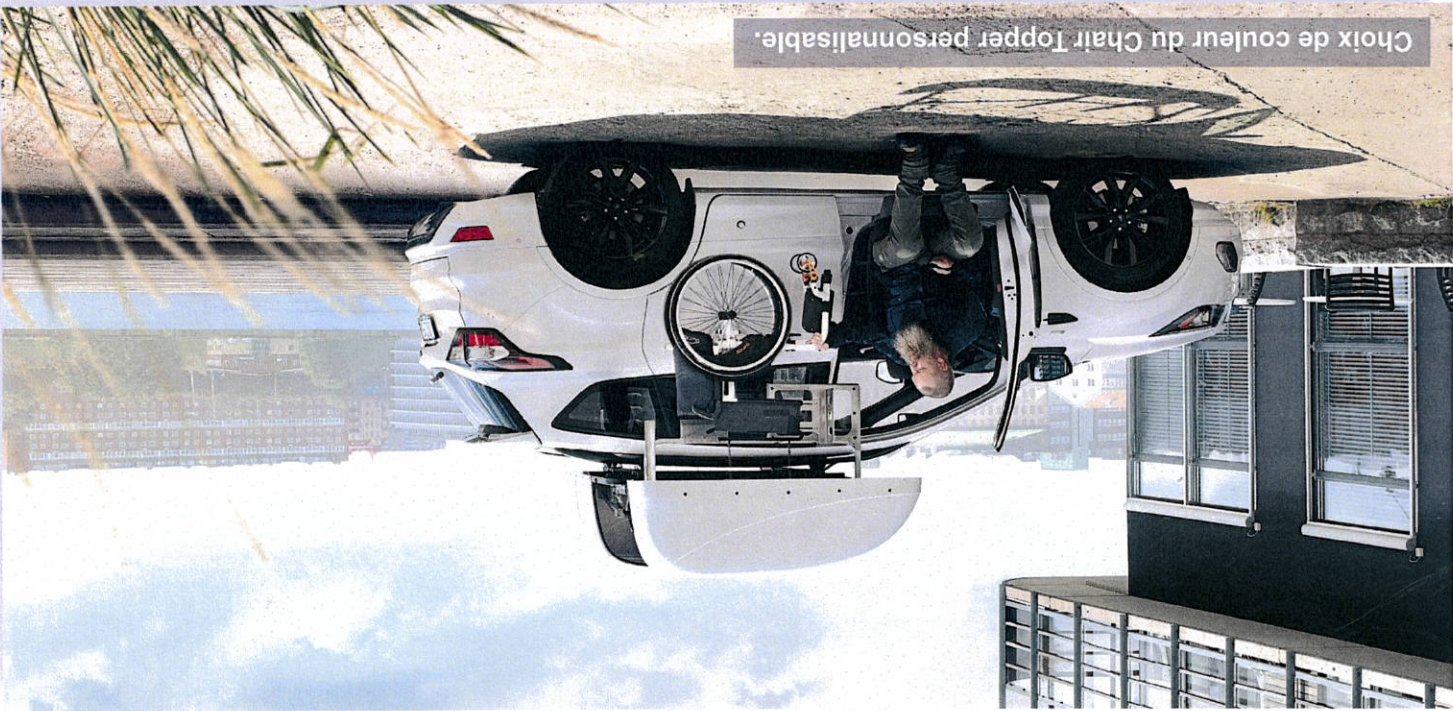
Choix de couleur du Chair Topper personnalisable.